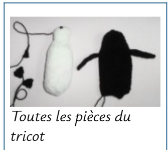
Toutes les pièces du tricot