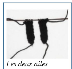
Les deux ailes