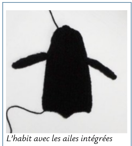
L'habit avec les ailes intégrées